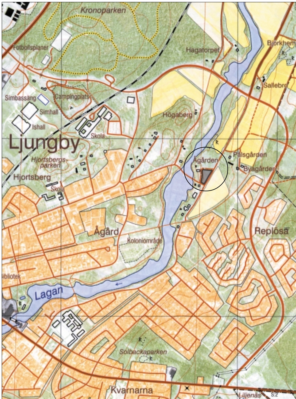
Fig. 1. Ekonomiska kartan, utdrag från blad 5D 0b. Utredningsområdet är markerat. Skala 1:10 000. Godkänd från sekretessynpunkt för spridning. Lantmäteriverket 2000-08-10.