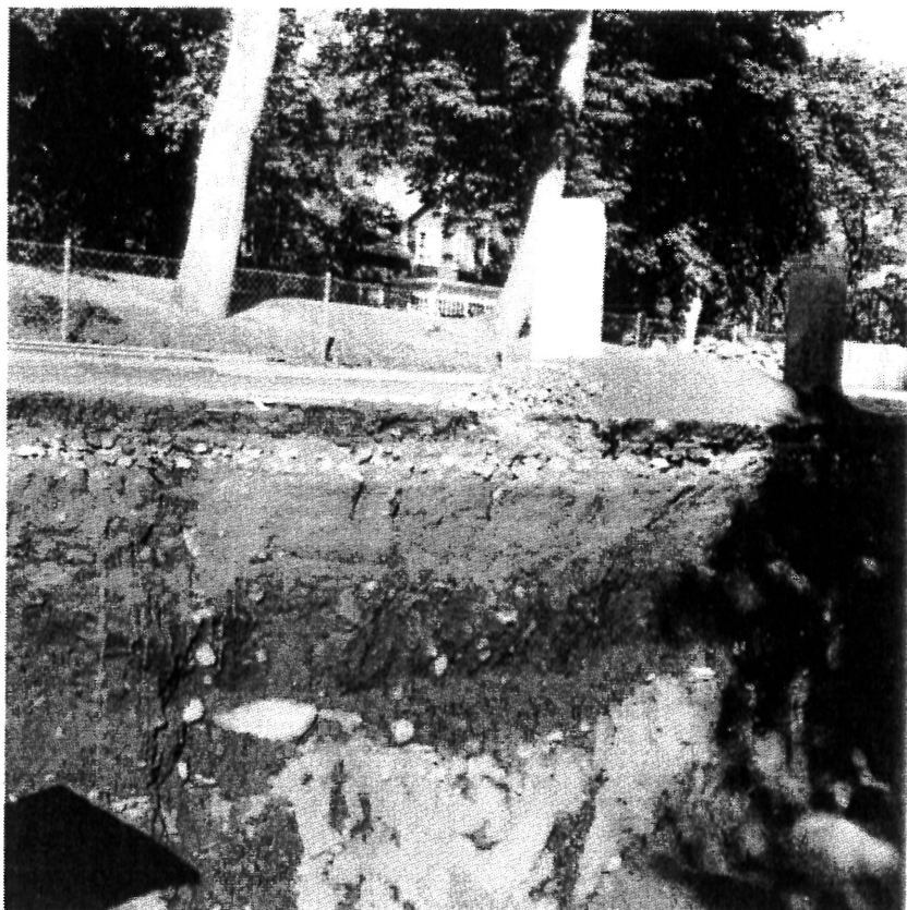
Kulturlagret under asfalt och fyllnadsmassor