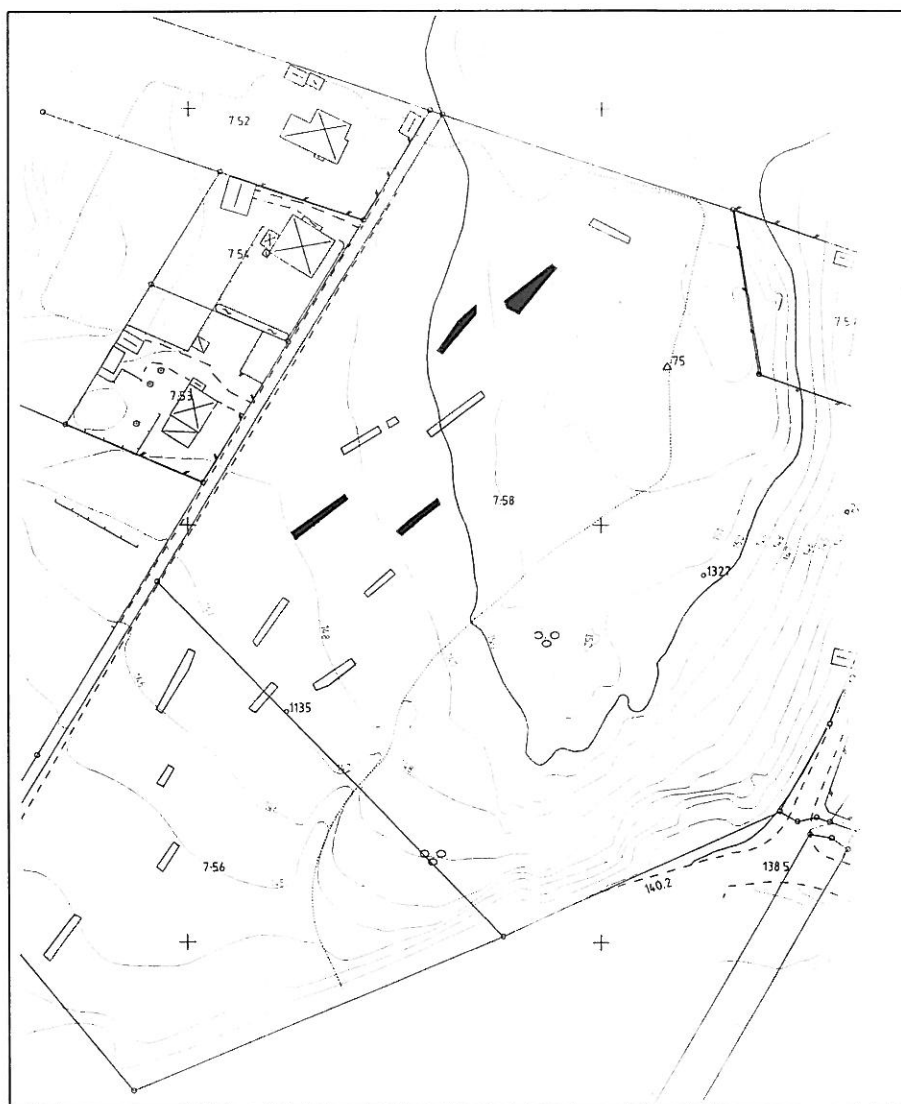
Fig 3. Utredningsområdet med de anläggningsförande schakten markerade. Skala ca 1:2000

I den södra delen av området, i det lägre partiet, framkom inga anläggningar. Några fynd påträffades inte i något av schakten eller i anläggningarna. Det är därför omöjligt att i det här skedet datera lämningarna.