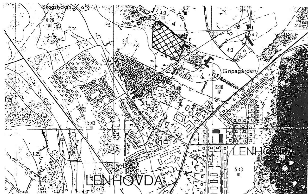
Utdrag ur ekonomiska kartan 5F 3d Lenhovda skala 1:10 000 Utredningsområdet skrafferat